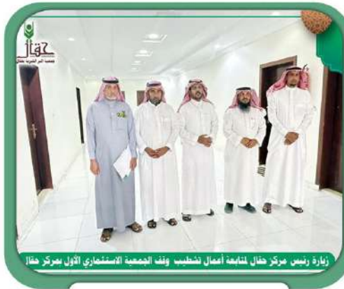
زيارة رئيس مركز حقال لمتابعة أعمال تشطيب وفد الجمعية الاستثماري الأول بمركز حقال