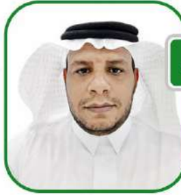
2 عبدالله بن عطية الثوري